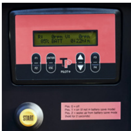
TP Pilot+. Styrning som säkerställer optimala förhållanden för föraren och arbetsmiljön