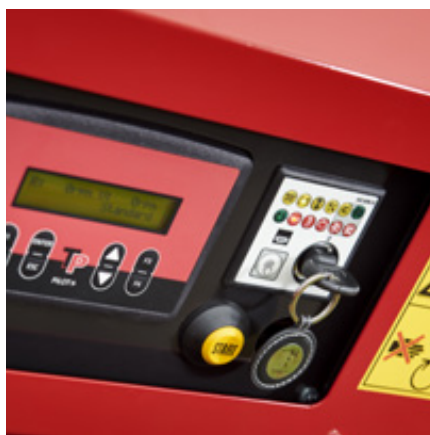
Pilot+ med interface-styrning, startbox och TP Starter