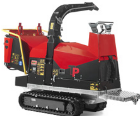
Manuell styrning och plattform