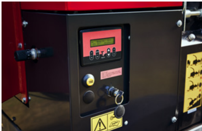
TP Pilot+. Styrning som säkerställer optimala förhållanden för operatör och arbetsmiljö