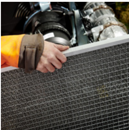
Motorfilter – snabb och enkel rengöring