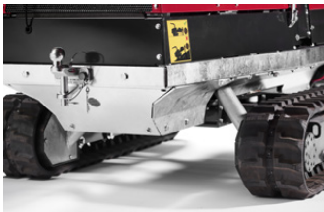
Marknadens högsta markfrigång: 200 mm, enkel service och solid slangkåpa. Variabel bandbredd 1 150-1 350 mm