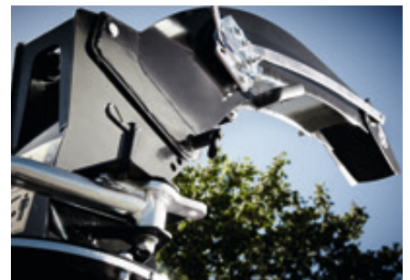
TP VARIO SPOUT™