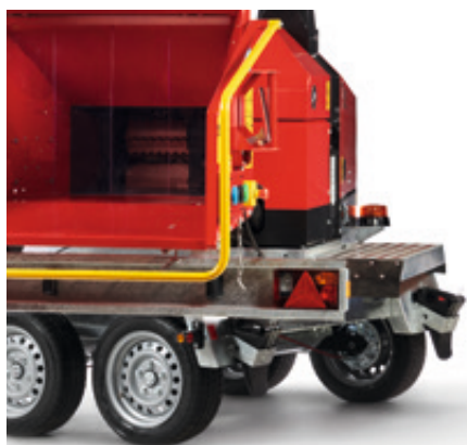
Mekanisk vridkrans med 10 positioner