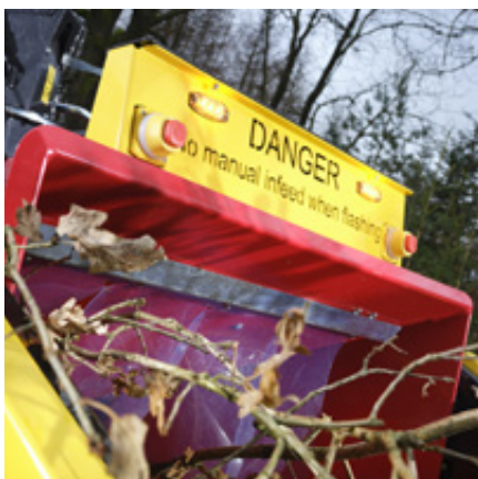
TP Fast Feeding som tillval för alla TP 215 och TP 280