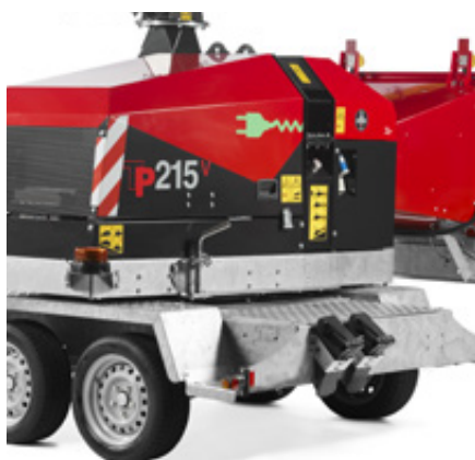
Mekanisk 225° vridkrans