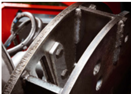
TP TWIN DISC™