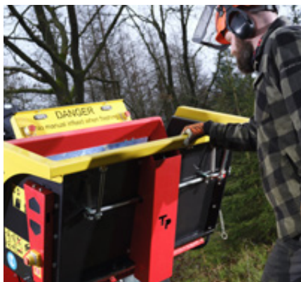
Enkel hantering av den förstärkta kraftiga tratten tack vare gasfjäder