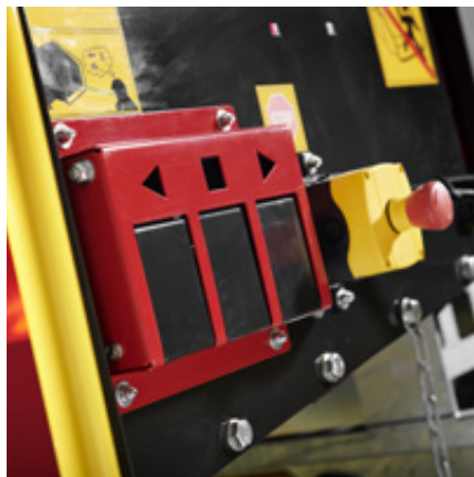
TP Easy Control: Återställning – Reversering – Inmatning