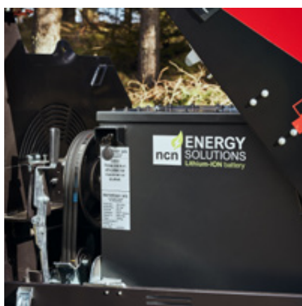
Kraftfullt 44 kWh batteri