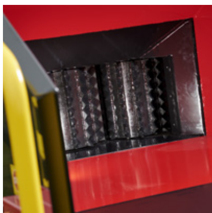
Lodräta stående aggressiva hjärtandsvalsar.

TP 280 Mobil är en in-liner, och kan med de olika varianterna användas på bl.a. Dragstången och axeln är anpassade efter dina exakta krav.