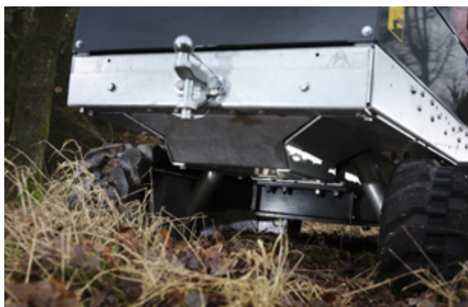
Marknadens högsta markfrigång: 250 mm, enkel service och solid slangkåpa. Variabel bältesbredd.