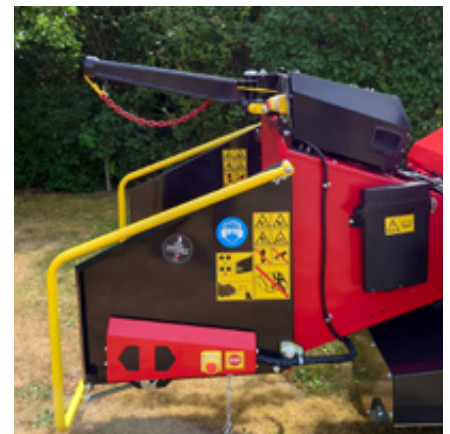
Hydraulisk vinsch kan läggas till alla TP 215 Mobile och Track modeller