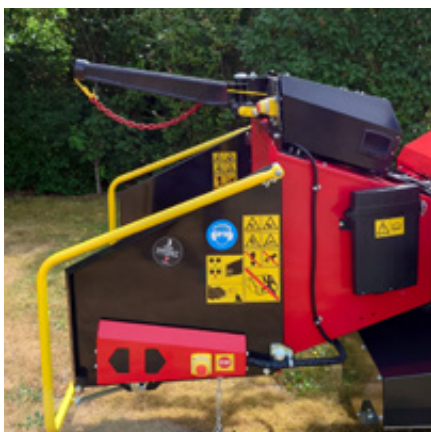
Hydraulisk vinsch (tillval)