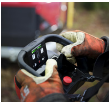
Danfoss fjärrkontroll för komfort