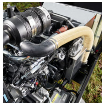
Hatz 4H50 Stage V-motor med 55 kW